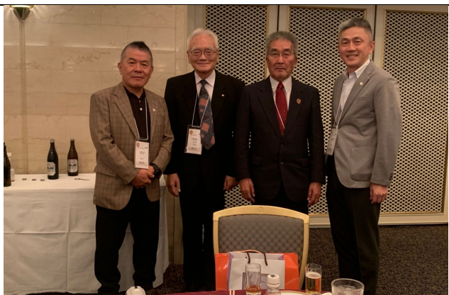
理事長與日本山岳大老神崎忠男先生合影