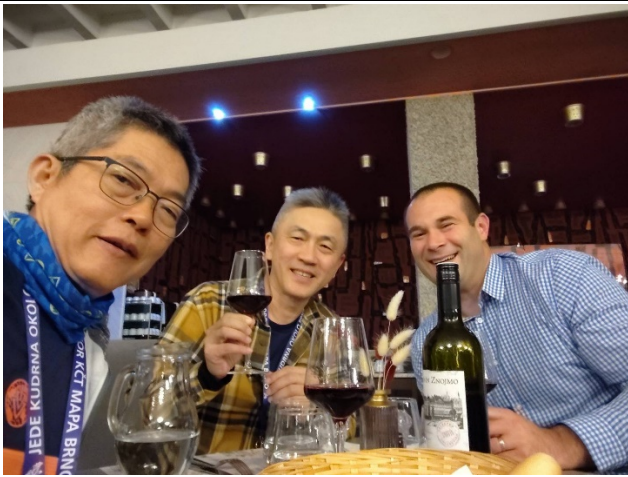
與各國代表餐敘合影