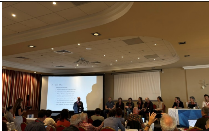
UIAA 辦公室成員及職責介紹