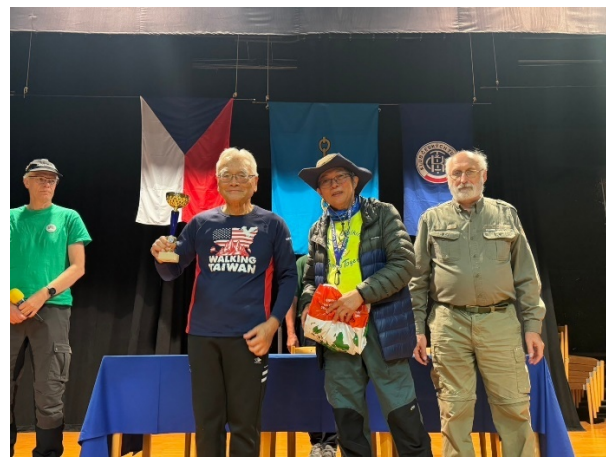
本會黃理事長與大會主席合影