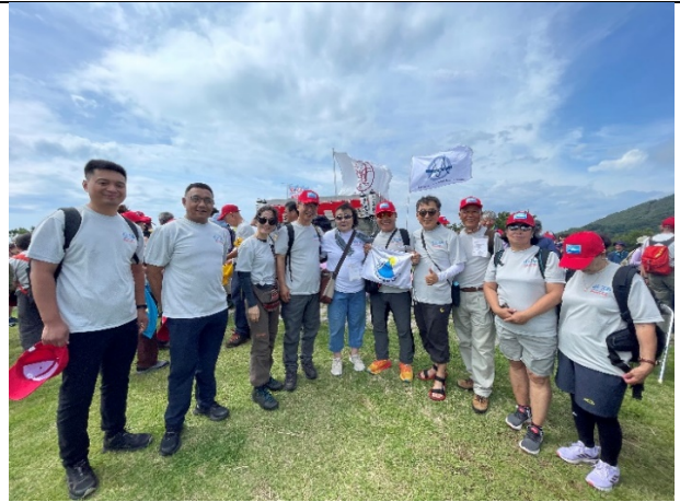
第 67 屆高頭祭 與各國代表合影