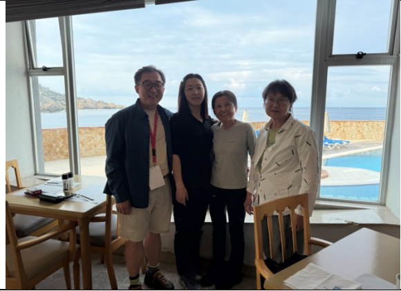
1110 與韓國及亞洲與會代表合照