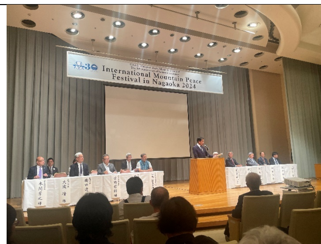
第 30 屆 UAAA 慶祝及國際山岳和平紀念大會