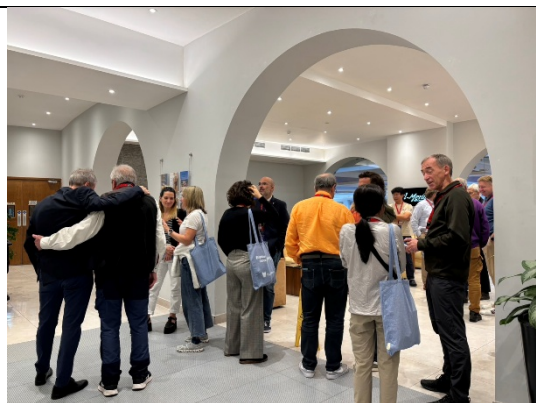
與管理委員挪威代表討論