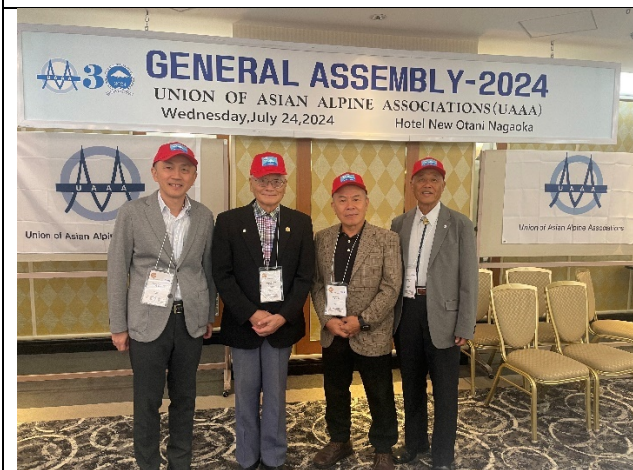
理事長等 4 位代表出席 UAAA 年會