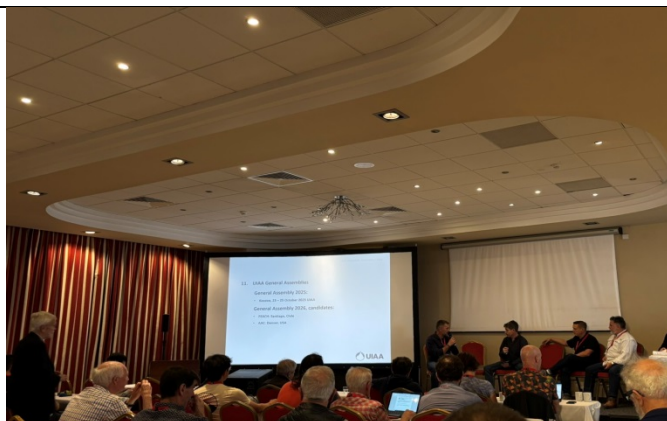
2025 大會於科索沃舉行 選舉 2026 大會場地