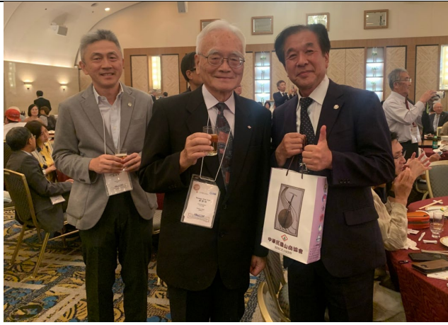
理事長致贈主辦大會 JMSCA 會長感謝禮