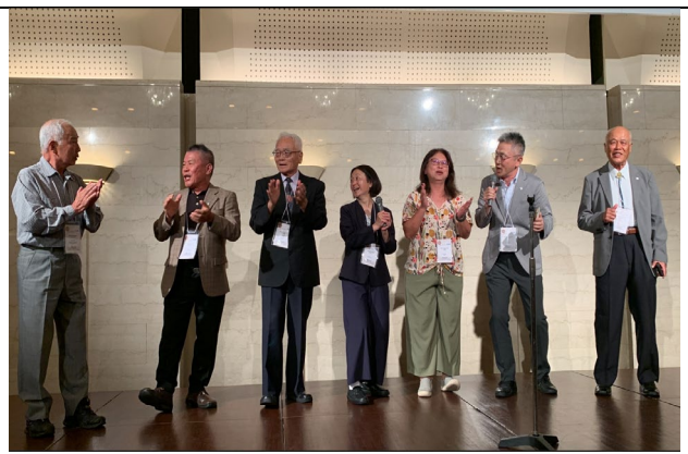
UAAA 30 週年慶祝晚宴台灣代表獻唱