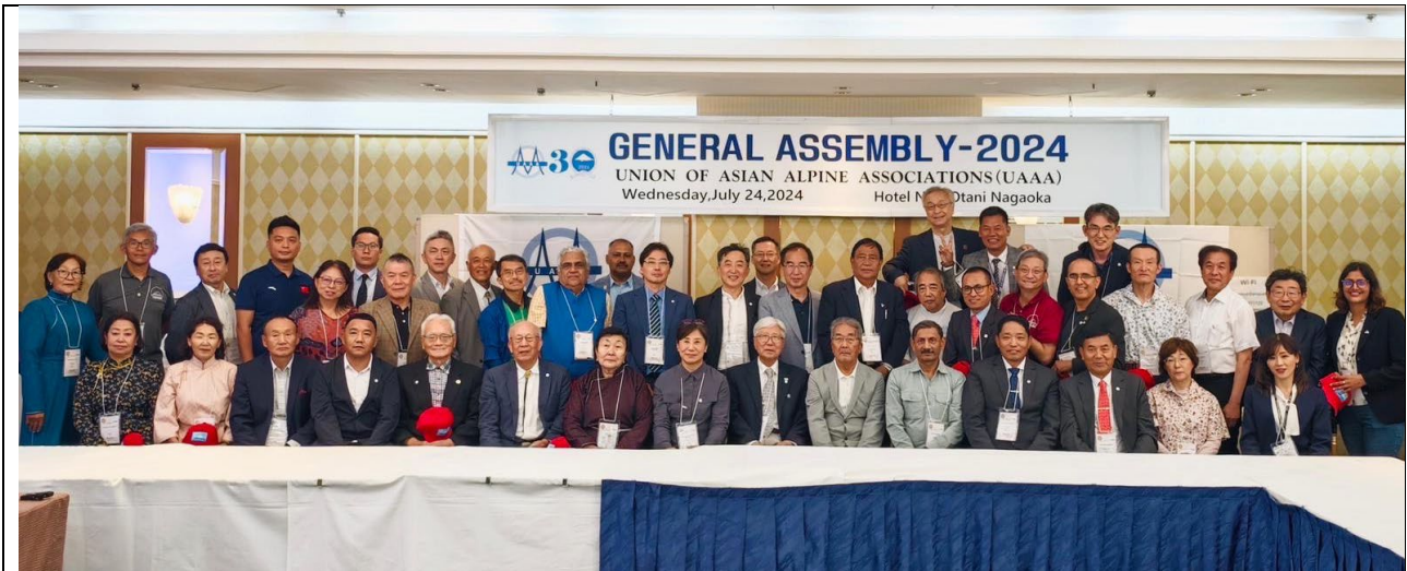
2024 UAAA 年會與會代表合照