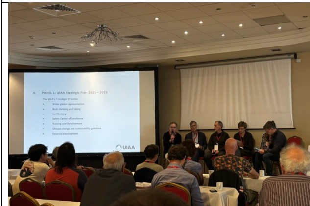
UIAA 2025-2028 策略