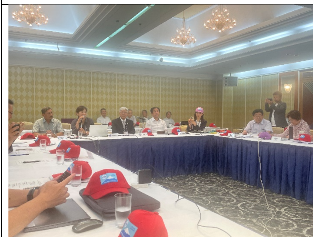
2024 UAAA 年會現場