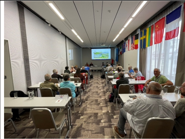
會議現場及座次安排(依英文字, 我國為 T)