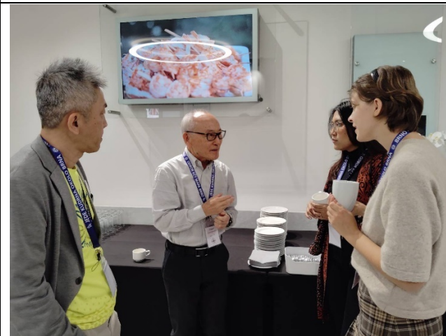
會議中場討論交流