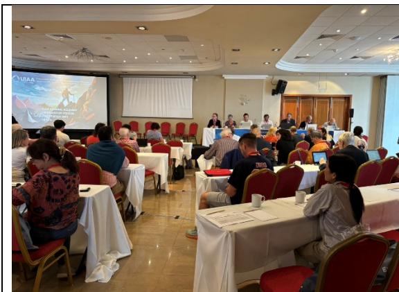
1107 會議現場, 自由入座, 無排序問題