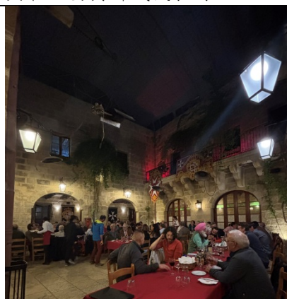
1108 餐聚集欣賞馬爾他民族舞蹈