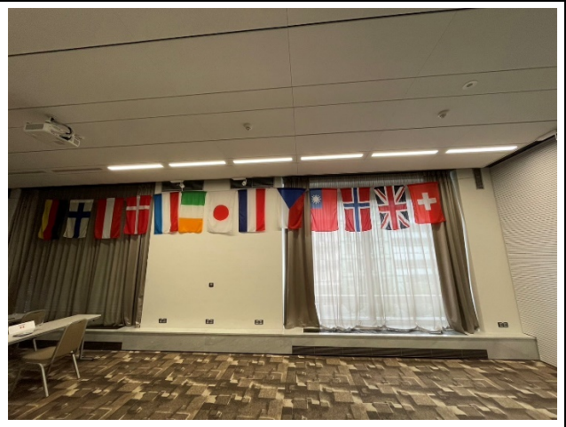
會場顯示中華民國國旗