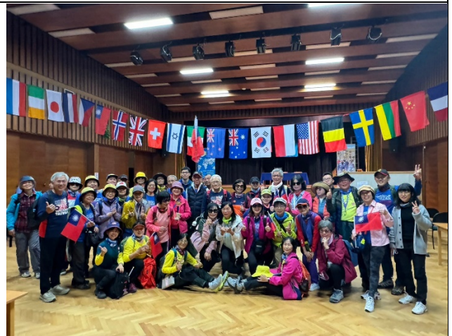
本會健行團參加捷克交流健行合影