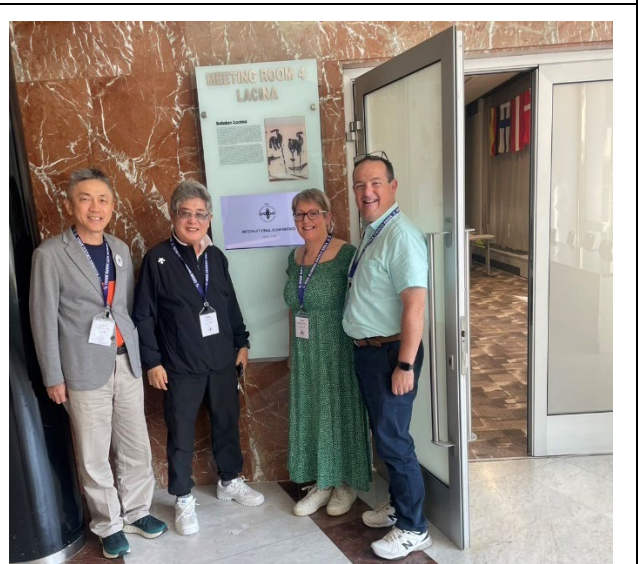
與韓國及愛爾蘭代表合影