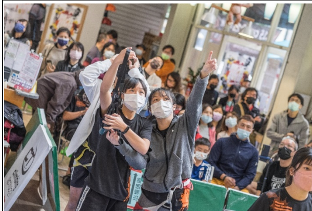
圖四照片說明：選手觀察比賽路線