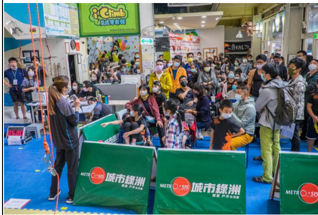
圖二照片說明：裁判說明攀登規則及注意事項