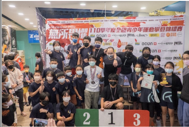
圖八照片說明：頒發團體獎項