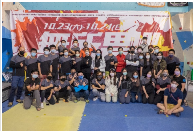
圖九照片說明：青少年賽工作人員大合照