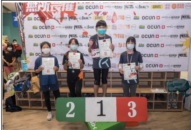
圖六照片說明：頒發獎項（小六一國一女子組）