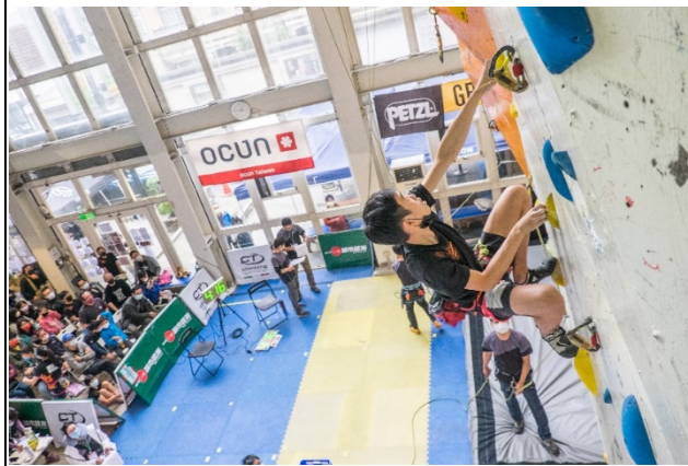
圖五照片說明：選手攀登中