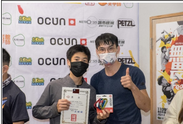
圖七照片說明：頒發獎品（國二—國三男子組）