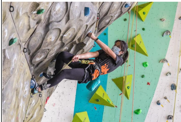
圖三照片說明：選手攀登中