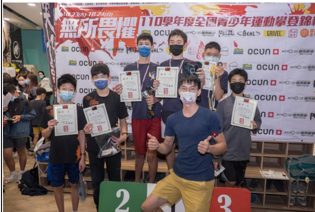
圖十照片說明：頒獎合照（國二—國三男子組）