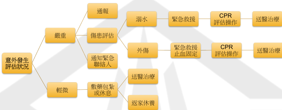
圖2 意外事故處理標準作業程序圖