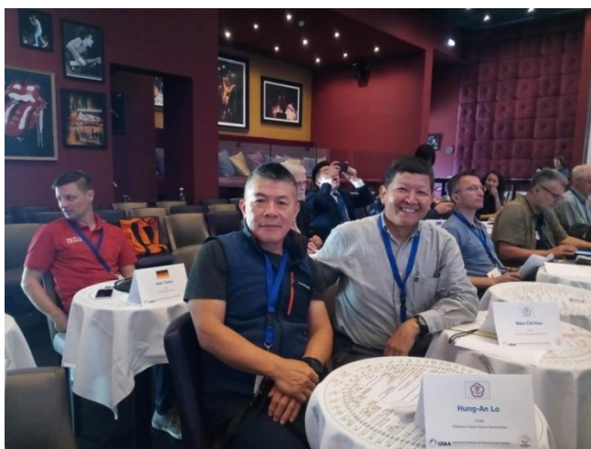
中華山岳協會 2 位與會代表