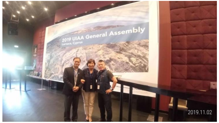
與 UAAA 秘書長合影