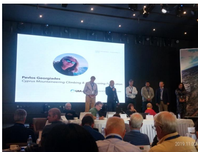
候選人介紹及政見發表