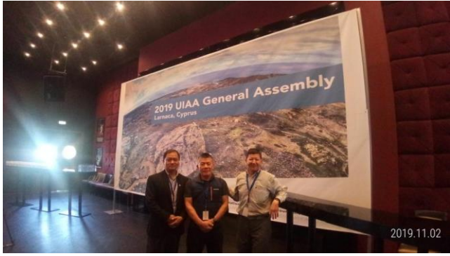
與尼泊爾代表合影