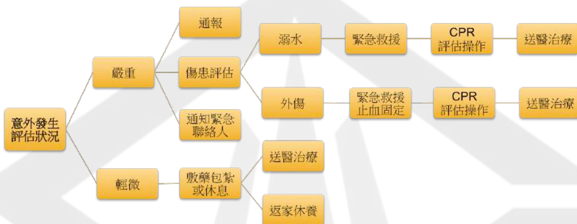
圖2 意外事故處理標準作業程序圖