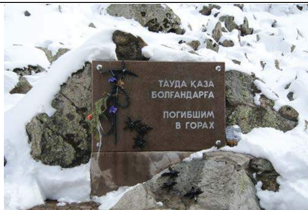
去山難紀念碑致意