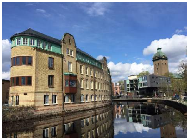
健行路線-市區風景