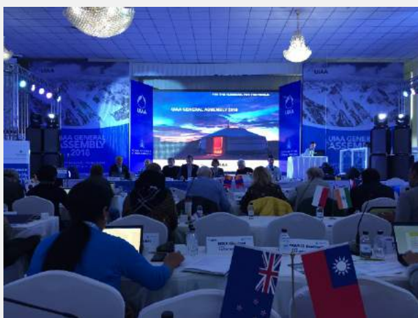
會議現場-正面舞台