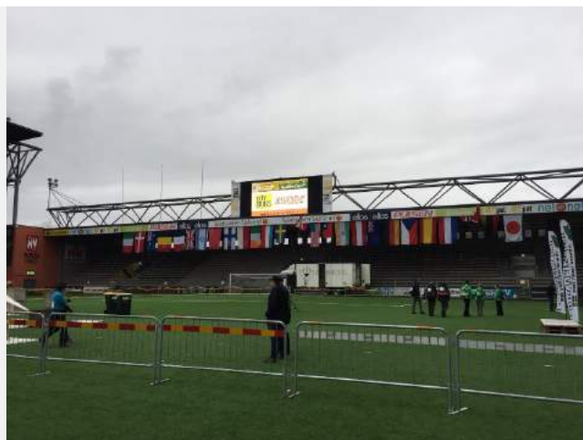
健行大會現場各國國旗飄揚