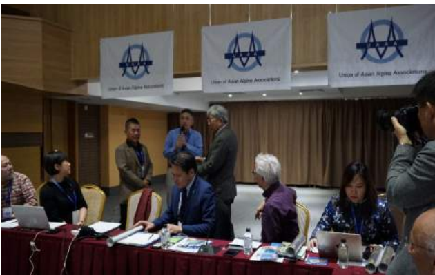
會議現場-UAAA 主席頒發紀念牌