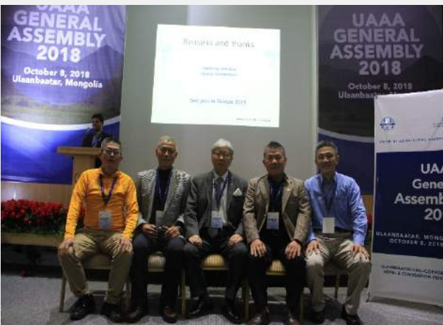
中華山岳代表與 UAAA 主席合影