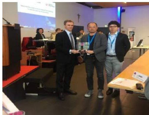
頒感謝狀獎給新的贊助商日航