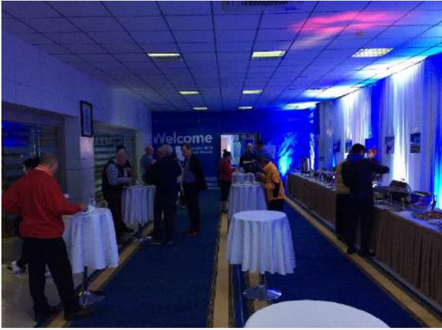
會議現場-午餐會場擺設