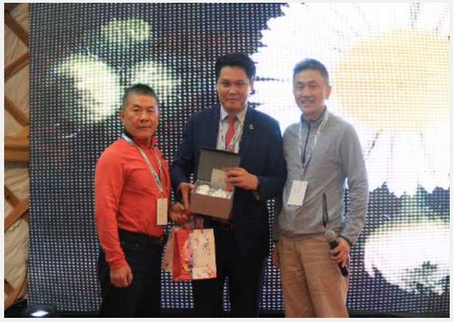
致贈主辦單位主席禮物合影