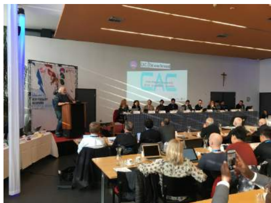
前秘書長希望 IFSC 繼續支持 CAC 6