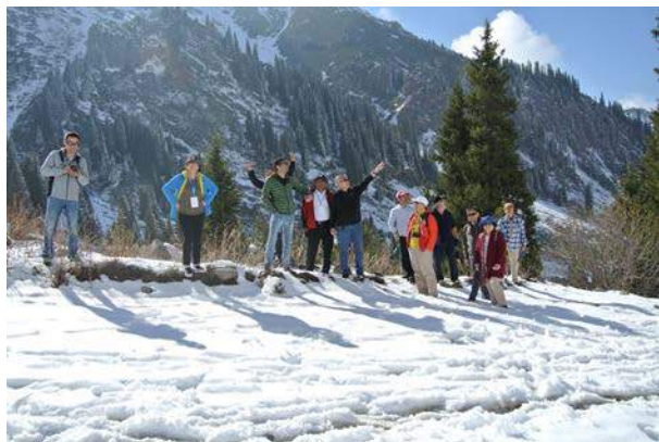
參觀天然岩場比賽場地