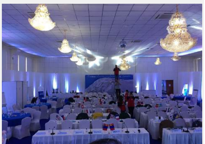
會議現場-會議桌擺設及各國國旗