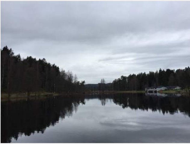
健行路線-湖泊風景