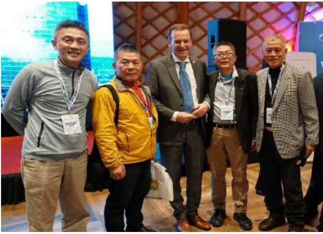
中華山岳代表與 UIAA 主席合影