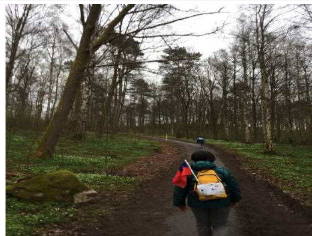
健行路線-山區風景