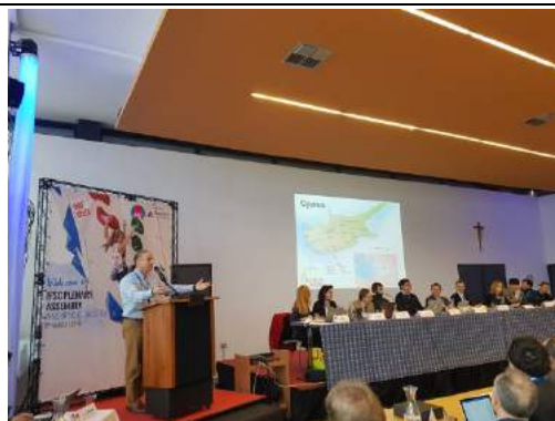
賽普勒斯協會爭取 2020 年年會