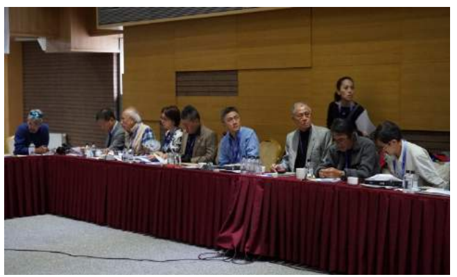
會議現場-中華山岳代表報告