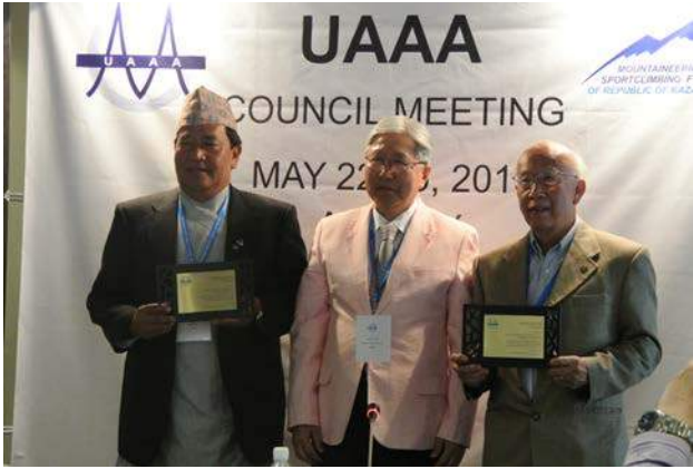
頒獎恭喜榮任理事長