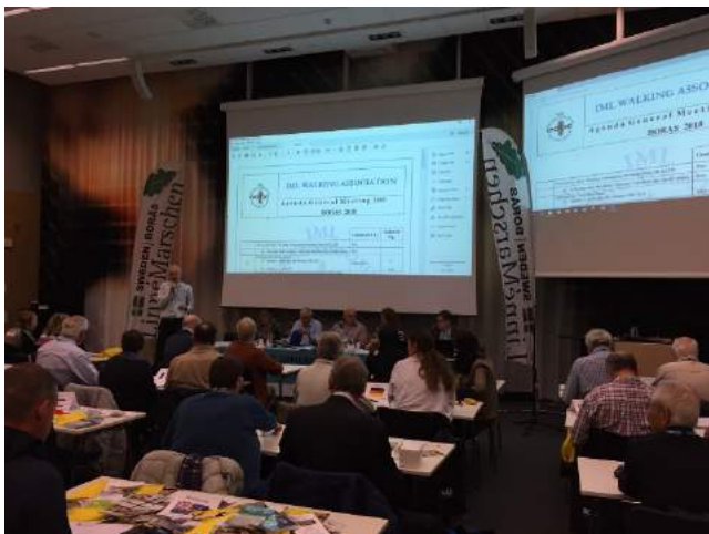
各國代表出席會議